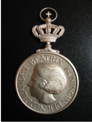
Onderscheiden met de Koninklijke Erepennenning